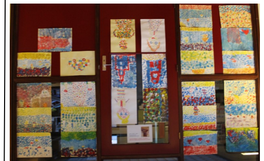
Groep 5/6 Pointillisme