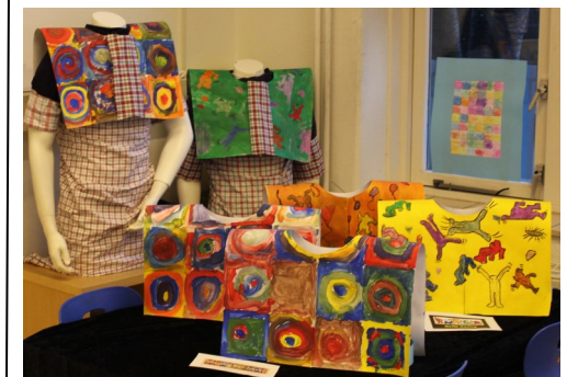
Groep 4 Kadinsky en Keith Haring