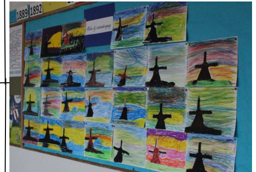
Groep 6/7 Van Gogh